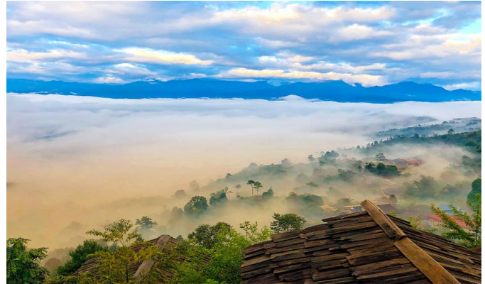
Khu sinh thái Suối Giàng