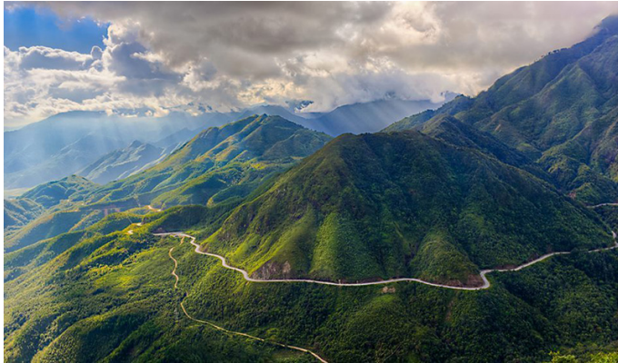
Đèo Khau Phạ

Đến Hà Nội , xe đưa Quý khách về điểm hẹn, kết thúc chương trình thăm quan! HDV cảm ơn và tạm biệt Quý khách. Hẹn gặp lại Quý khách trong các chương trình tiếp theo!