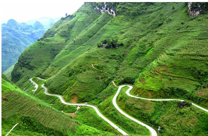
Đèo Mã Pì Lèng

Tối 19h00: Đoàn dùng bữa tối với đặc sản Lẩu Gà Đen , sau bữa tối Quý khách tản bộ tham quan Phố cổ Đồng Văn nằm tại trung tâm thị trấn Đồng Văn. Mặc dù không có quy mô lớn như phố cổ Hà Nội hay Hội An nhưng nơi đây vẫn mang những bản sắc riêng, hấp dẫn du khách với khoảng 40 nóc nhà trên dưới 100 tuổi nằm cạnh nhau dưới chân núi đá. Đặc biệt quý khách có dịp thưởng thức café Phố cổ trong những quán café mang đậm kiến trúc giao thoa bản địa và Trung Hoa và tận hưởng không khí trong lành, yên bình đậm không khí Tết của người dân bản địa. Nghỉ đêm tại khách sạn thị trấn Đồng Văn.